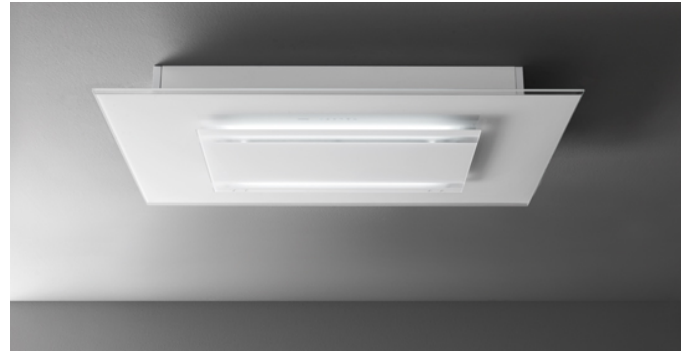
The photograph is purely for information It may not correspond to the selected version.